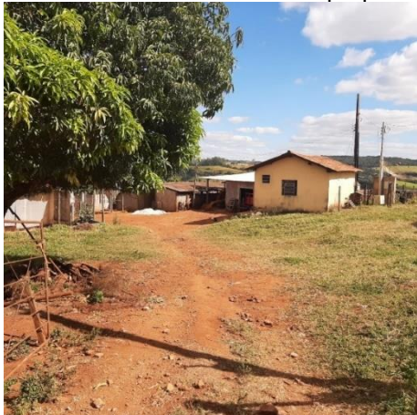
Figura 02: Vista da casa sede da propriedade.