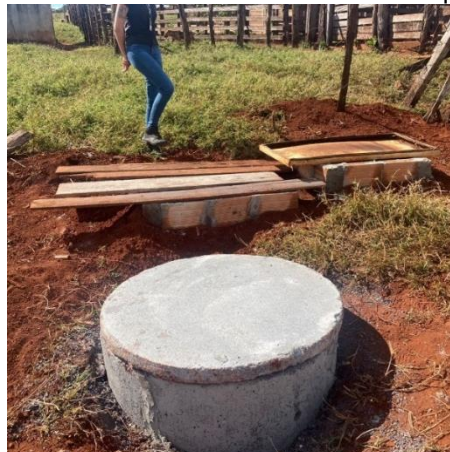
Figura 07: Sistema de tratamento do chiqueiro.