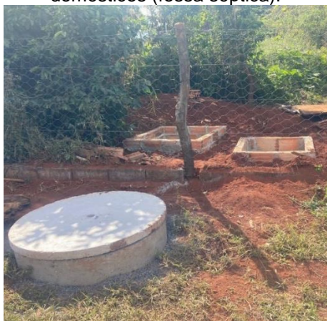
Figura 08: Sistema de tratamento de efluentes domésticos (fossa séptica).