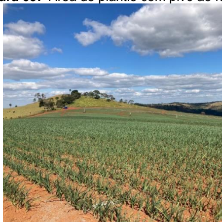
Figura 09: Área de plantio com pivô ao fundo.