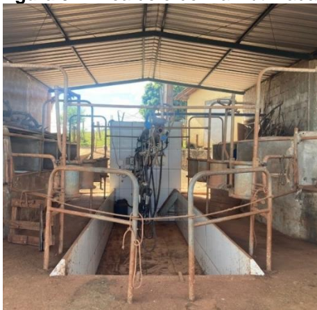
Figura 04: Área de ordenha inutilizada.