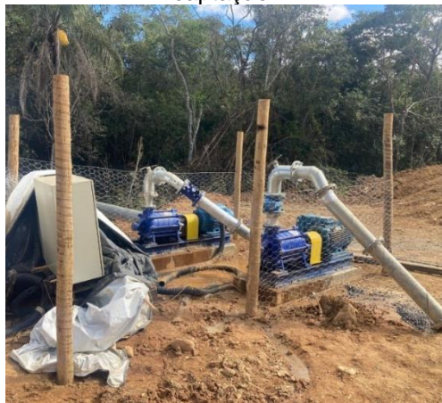
Figura 12: Sistema de bombas do ponto de captação.