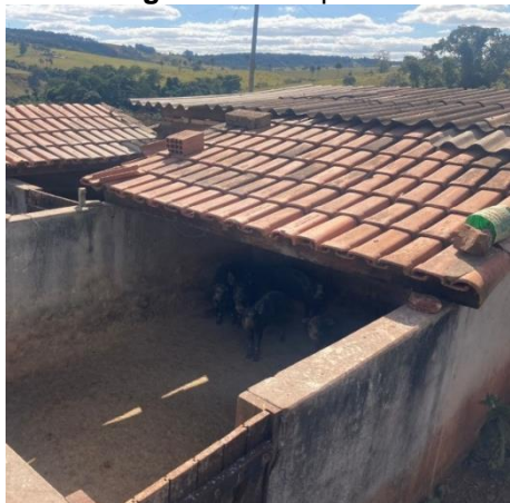
Figura 06: Chiqueiro.