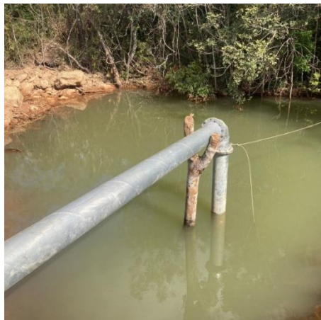
Figura 13: Vista do ponto de captação.