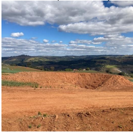
Figura 03: Bolsões para conservação de solo.