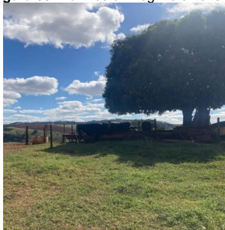
Figura 05: Bovinos em regime extensivo.