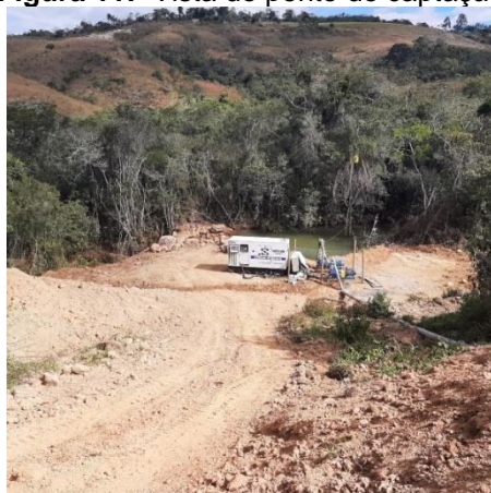
Figura 11: Vista do ponto de captação.